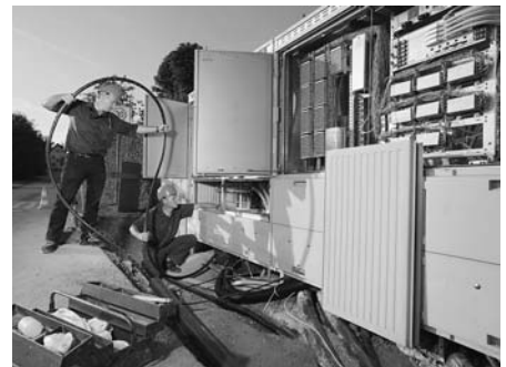
Techniker der Deutschen Telekom bauen das Breitbandnetz aus.